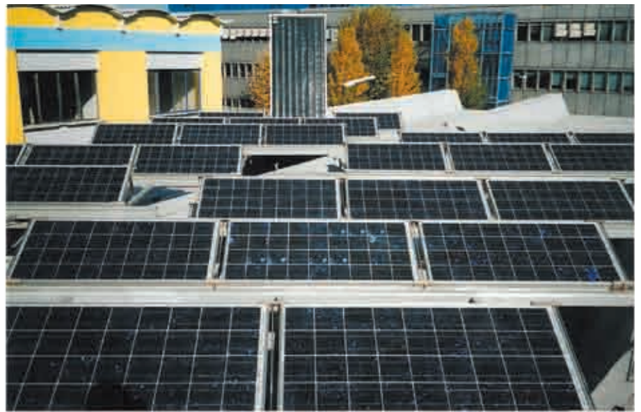
Pannelli fotovoltaici sul tetto