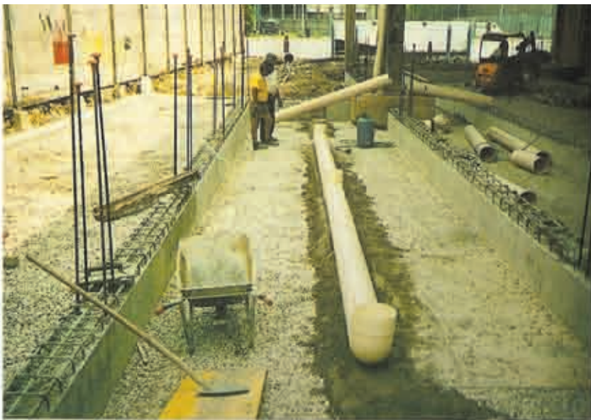
Posa del sistema di ventilazione naturale