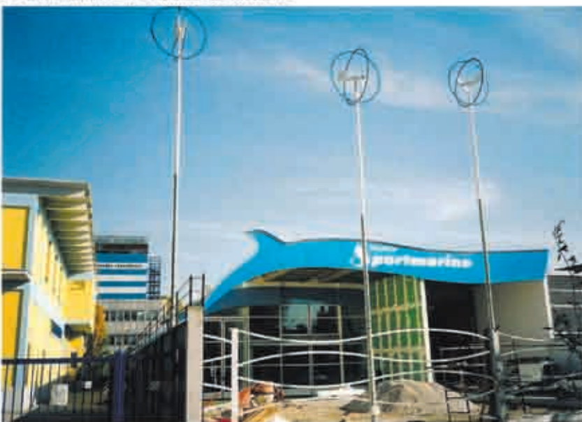
I tre aerogeneratori